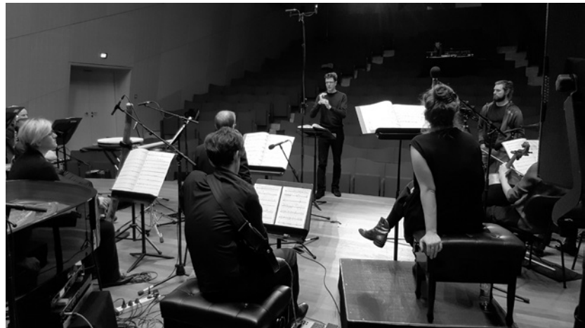
Rehearsals for FACE