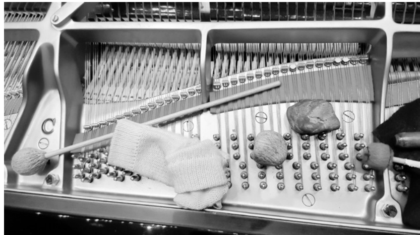
Philharmonie Luxembourg (© Pierluigi Billone)